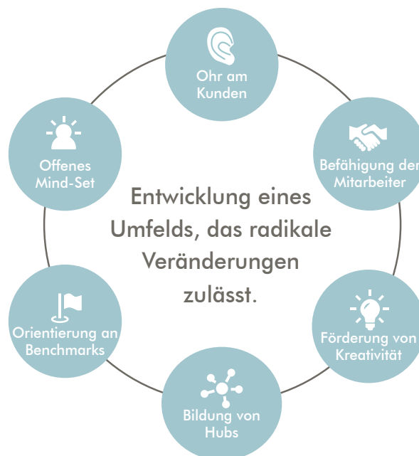
Abbildung 4: Ansatzpunkte zur Entwicklung eines Umfelds, das radikale Veränderungen zulässt

2. Die Befähigung der Mitarbeiter: Mitarbeiter können dann eine Quelle für Inspiration und Anregung werden, wenn man sie hört und einbezieht. Sie verfügen oft über Tiefenkenntnisse in ihren Verantwortungsbereichen, die dem Top-Management verschlossen sind. Diese Quelle wird zu wenig systematisch genutzt und versiegt zu häufig.