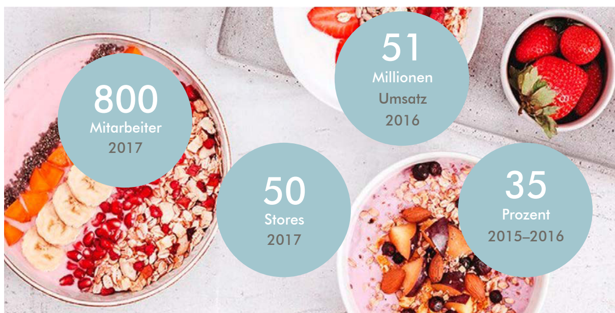
Abbildung 2: mymuesli – Das Paradebeispiel eines Start-ups, das mit einer scheinbar so einfachen Idee erfolgreich wurde.

Die Kunst vieler erfolgreicher Herausforderer liegt nicht darin, möglichst viele Wünsche und Bedürfnisse der Kunden abdecken zu wollen, sondern mit voller Aufmerksamkeit auf ein kleines Territorium zuzugreifen. Hier gilt: je klarer der Fokus, desto größer der Erfolg. Popp Brotaufstrich hat für sich ein klares Territorium definiert und belegt: „Der Brotaufstrich