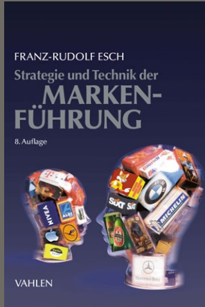
Strategie und Technik der Markenführung 8., überarbeitete und erweiterte Auflage (2014), 790 Seiten, ISBN: 978-3-8006-4856-6

Ausgezeichnet mit dem George-Bergler Preis der GfK und des Fachverlags Handelsblatt für die gelungene Verbindung von Wissenschaft und Praxis. Dieser Klassiker zeigt die Rahmenbedingungen, Ziele und Grundsatzstrategien der Markenführung auf. Er stellt die Entwicklungen und Umsetzung der Markenidentität und Markenpositionierung ausführlich dar. Der Aufbau, die Gestaltung, die Kommunikation sowie das Wachstum von Marken werden detailliert analysiert. Komplexe Entscheidungen zur Markendehnung, zur Bildung von Markenallianzen sowie zur Führung von Markenportfolios und Markenarchitekturen beschreibt das Werk in bestechender Form. Die achte Auflage berücksichtigt außerdem aktuelle Entwicklungen wie insbesondere Social Media und virale Verbreitung von Markenbotschaften, Touchpoint Management, Employer und Internal Branding.