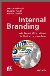
Internal Branding 1. Auflage (2014), 188 S., ISBN: 978-3-8006-4794-1

Die Werbelandschaft ist voll mit austauschbarer, langweiliger und blutleerer Werbung, die keinen Beitrag zur Markenaktualisierung und Markenprofilierung leistet. Es klafft eine Professionalitätslücke bei der Entwicklung und Umsetzung von Werbung. Die Werbung ist an die sich ständig verschärfenden Markt- und Kommunikationsbedingungen anzupassen. Dies gilt sowohl für den klassischen Werbebereich als auch für Werbung im Internet sowie andere neue Medien. Strategien und Techniken der Werbung werden in der vorliegenden achten Auflage wissenschaftlich fundiert, anschaulich und auf dem neusten Stand internationaler Erkenntnisse vermittelt. Dabei fließen verhaltens- und neurowissenschaftliche Erkenntnisse zur Werbewirkung mit ein. Zahlreiche Praxisbeispiele dienen der Veranschaulichung.