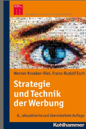
Strategie und Technik der Werbung 8., aktualisierte und überarbeitete Auflage (2015), 460 Seiten, ISBN: 978-3-1702-6258-4,

Ausgezeichnet mit dem George-Bergler Preis der GfK und des Fachverlags Handelsblatt für die gelungene Verbindung von Wissenschaft und Praxis. Dieser Klassiker zeigt die Rahmenbedingungen, Ziele und Grundsatzstrategien der Markenführung auf. Er stellt die Entwicklungen und Umsetzung der Markenidentität und Markenpositionierung ausführlich dar. Der Aufbau, die Gestaltung, die Kommunikation sowie das Wachstum von Marken werden detailliert analysiert. Komplexe Entscheidungen zur Markendehnung, zur Bildung von Markenallianzen sowie zur Führung von Markenportfolios und Markenarchitekturen beschreibt das Werk in bestechender Form. Die achte Auflage berücksichtigt außerdem aktuelle Entwicklungen wie insbesondere Social Media und virale Verbreitung von Markenbotschaften, Touchpoint Management, Employer und Internal Branding.