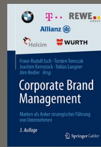
Corporate Brand Management – Marken als Anker strategischer Führung von Unternehmen 3., überarbeitete Auflage (2014), 400 S., ISBN: 978-3-8349-3446-8

Marken werden nicht nur durch Produkte und Marketingkommunikation aufgebaut, sondern auch durch das Verhalten aller Mitarbeiter des Unternehmens. Die Autoren zeigen Methoden zur Analyse der Schwachstellen im Brand Behavior des Mitarbeiters auf. Sie entwickeln ein strategisches Konzept, um die Marke durch Mitarbeiter-Kunden-Interaktion zu stärken. Zur Veranschaulichung werden aktuelle Ergebnisse aus Forschungsprogrammen sowie Beiträge von Praktikern aus unterschiedlichen Branchen aufgeführt.