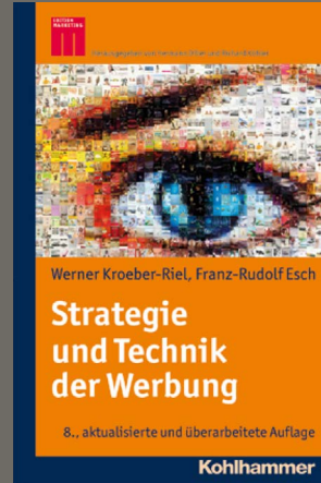
Strategie und Technik der Werbung 8., aktualisierte und überarbeitete Auflage (2015), 460 Seiten, ISBN: 978-3-1702-6258-4, ET: vorauss. Juni 2015

Ausgezeichnet mit dem George-Bergler Preis der GfK und des Fachverlags Handelsblatt für die gelungene Verbindung von Wissenschaft und Praxis. Dieser Klassiker zeigt die Rahmenbedingungen, Ziele und Grundsatzstrategien der Markenführung auf. Er stellt die Entwicklungen und Umsetzung der Markenidentität und Markenpositionierung ausführlich dar. Der Aufbau, die Gestaltung, die Kommunikation sowie das Wachstum von Marken werden detailliert analysiert. Komplexe Entscheidungen zur Markendehnung, zur Bildung von Markenallianzen sowie zur Führung von Markenportfolios und Markenarchitekturen beschreibt das Werk in bestechender Form. Die achte Auflage berücksichtigt außerdem aktuelle Entwicklungen wie insbesondere Social Media und virale Verbreitung von Markenbotschaften, Touchpoint Management, Employer und Internal Branding.