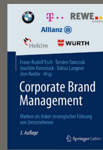
Corporate Brand Management – Marken als Anker strategischer Führung von Unternehmen 3., überarbeitete Auflage (2014), 400 S., ISBN: 978-3-8349-3446-8

Marken werden nicht nur durch Produkte und Marketingkommunikation aufgebaut, sondern auch durch das Verhalten aller Mitarbeiter des Unternehmens. Die Autoren zeigen Methoden zur Analyse der Schwachstellen im Brand Behavior des Mitarbeiters auf. Sie entwickeln ein strategisches Konzept, um die Marke durch Mitarbeiter-Kunden-Interaktion zu stärken. Zur Veranschaulichung werden aktuelle Ergebnisse aus Forschungsprogrammen sowie Beiträge von Praktikern aus unterschiedlichen Branchen aufgeführt.