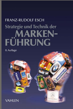
Strategie und Technik der Markenführung 8., überarbeitete und erweiterte Auflage (2014), 790 Seiten, ISBN: 978-3-8006-4856-6

Ausgezeichnet mit dem George-Bergler Preis der GfK und des Fachverlags Handelsblatt für die gelungene Verbindung von Wissenschaft und Praxis. Dieser Klassiker zeigt die Rahmenbedingungen, Ziele und Grundsatzstrategien der Markenführung auf. Er stellt die Entwicklungen und Umsetzung der Markenidentität und Markenpositionierung ausführlich dar. Der Aufbau, die Gestaltung, die Kommunikation sowie das Wachstum von Marken werden detailliert analysiert. Komplexe Entscheidungen zur Markendehnung, zur Bildung von Markenallianzen sowie zur Führung von Markenportfolios und Markenarchitekturen beschreibt das Werk in bestechender Form. Die achte Auflage berücksichtigt außerdem aktuelle Entwicklungen wie insbesondere Social Media und virale Verbreitung von Markenbotschaften, Touchpoint Management, Employer und Internal Branding.