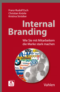
Internal Branding 1. Auflage (2014), 188 S., ISBN: 978-3-8006-4794-1

Die Werbelandschaft ist voll mit austauschbarer, langweiliger und blutleerer Werbung, die keinen Beitrag zur Markenaktualisierung und Markenprofilierung leistet. Es klafft eine Professionalitätslücke bei der Entwicklung und Umsetzung von Werbung. Die Werbung ist an die sich ständig verschärfenden Markt- und Kommunikationsbedingungen anzupassen. Dies gilt sowohl für den klassischen Werbebereich als auch für Werbung im Internet sowie andere neue Medien. Strategien und Techniken der Werbung werden in der vorliegenden achten Auflage wissenschaftlich fundiert, anschaulich und auf dem neusten Stand internationaler Erkenntnisse vermittelt. Dabei fließen verhaltens- und neurowissenschaftliche Erkenntnisse zur Werbewirkung mit ein. Zahlreiche Praxisbeispiele dienen der Veranschaulichung.