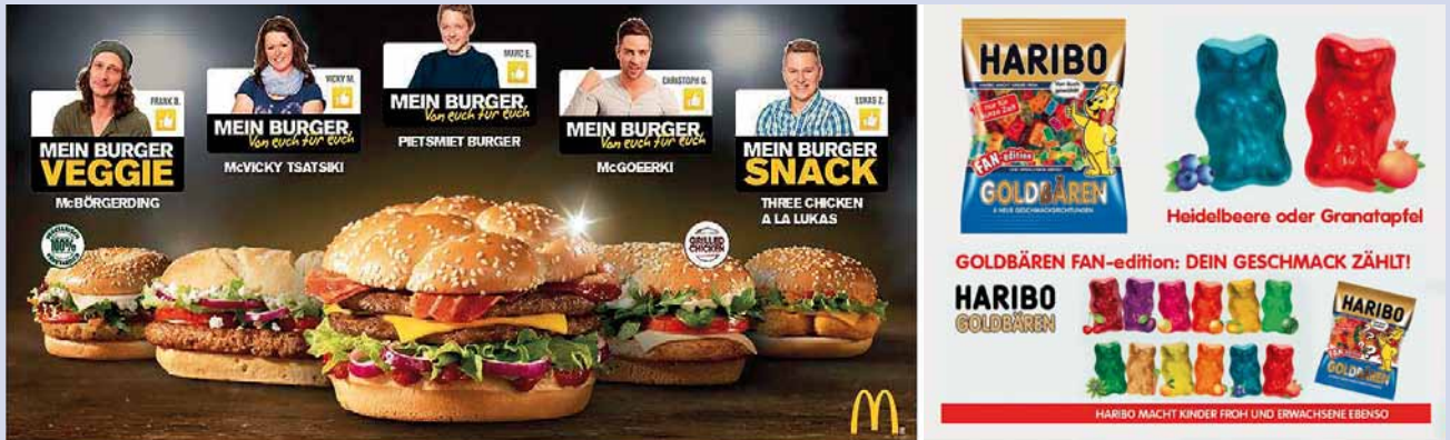
Abb. 2: McDonalds „My Burger“ und Haribo Fan-Edition