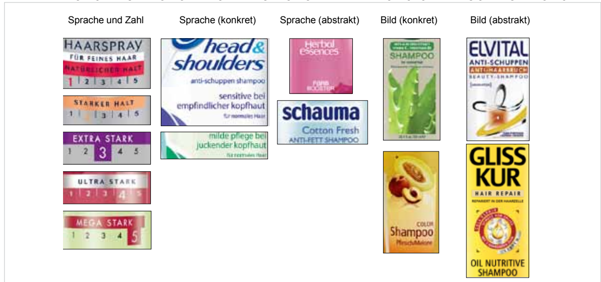
Damit sich ein Produktsortiment erschließt, sollte die Benennung der einzelnen unter einer Marke geführten Produkte verständlich, klar und trennscharf sein. So tragen die Haarstyling-Produkte von 3 Wetter Taft aufsteigende Zahlen je nach Intensität des Halts.

Entscheidend für den Erfolg einer Dachmarkenanbindung ist eine hohe Markenstärke, die Relevanz für die zu markierende Produktkategorie sowie der wahrgenommene Fit. Zur optimalen Wahrnehmbarkeit der Anbindung sind neben dem Logo auch die Verpackung und die Kommunikation entsprechend zu gestalten. Dabei gilt es, den Spagat zwischen Synergie und Eigenständigkeit erfolgreich zu managen, das heißt einerseits die Eigenständigkeit der Marke zu bewahren, andererseits jedoch die Anbindung an die Dachmarke deutlich zu machen. Ferner muss die vertikale Struktur der Forderung nach »Mental Convenience« gerecht werden, das heißt logisch und verständlich sein.