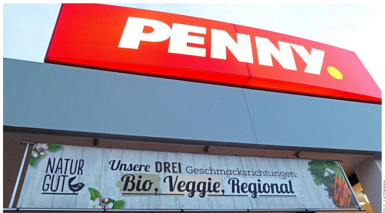
Bessere Ausgangsposition: Händler, die – wie Penny – ihrem Unternehmen ein besonderes Profil geben, heben sich vom Wettbewerb ab und realisieren höhere Umsätze.

Zum einen muss die Identität der Retail Brand klar festgelegt werden. Das erfordert eine Entscheidung über die Frage: Welche Markenwerte sind wesensprägend für die Retail Brand, und wie lässt