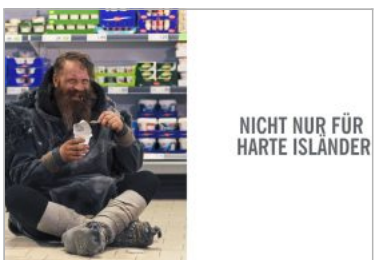
Protein-Power: Endlich gefunden – Wikinger löffelt Skyr mit Vergnügen.

schließlich im Kühlregal findet, treibt es dem Wikinger die Freudentränen in die Augen, und es entlockt ihm ein „Huh“ – was wohl an den Schlachtruf der Isländer bei der EM in Frankreich erinnern soll. Der Clip fand großen Anklang. In weniger als 24 Stunden wurde er allein bei Facebook mehr als 1,5 Millionen Mal angesehen. Der 35-sekündige Spot kommt auf über 7.000 Likes. dr/lz 34-16